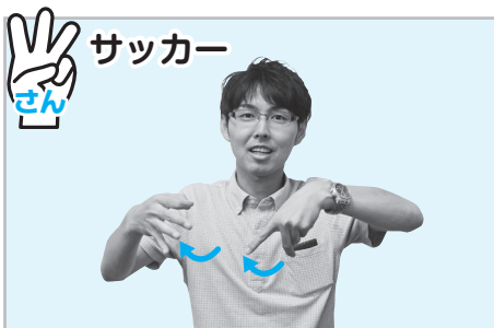
▲片手の親指と人差し指でボールの丸、片手の人差し指と中指で足を作って、蹴り出す仕草