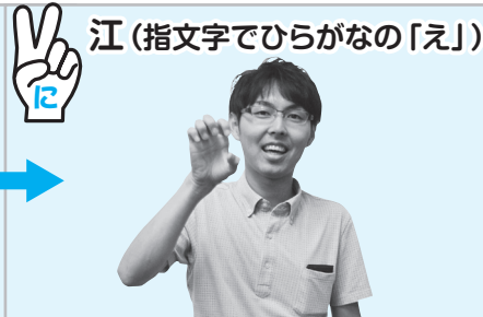
▲手のひらを見せて、指の第2・3関節を曲げる