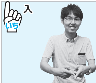
▲両手の人差し指で漢字の「入」をつくる