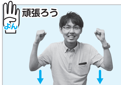
▲両手でこぶしを握り、2回上下させる