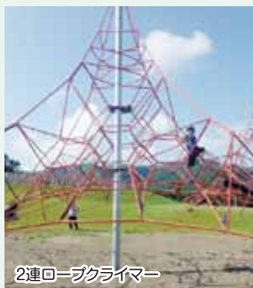
2連ロープクライマー