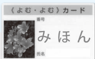
▲市立室蘭図書館の利用者カード「よむ・よむカード」