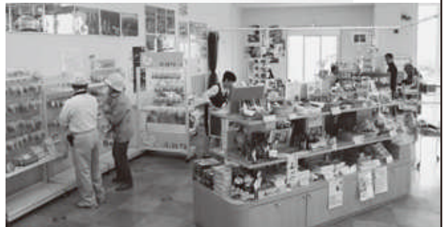
売店を移設し、買い物しやすくなりました。