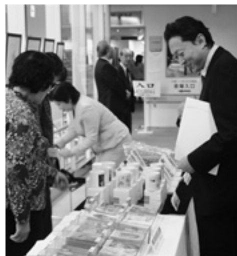
市民会館で行われた「芸能人の 多才な美術展」（平成16年）