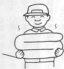
気持ち良くなるね! 寝られる

クリーニング店が定期的に自宅に布団を回収に伺い、工場乾燥させてきます。その間は、代わりの布団を用意していただきますので安心してください。数日後に軽くなった清潔な布団をお届けします。