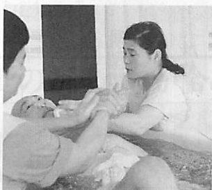
工夫された浴槽に安心して入浴が

重度の場合は白鳥ハイツの浴 槽を利用し入浴サービスを受け ることが出来ます。 白鳥ハイツでは、車のない人