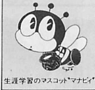
生涯学習のマスコット「マナビ」

サッカーや野球に汗を流す子供たち、バレーボールや卓球に親しみ明るい家庭づくりに励むお母さん、テニスやエアロビクスダンスでシェイプアップするヤングレディー、ジョギングやゴルフで運動不足を解消するお父さん、ゲートボールを楽しむお年寄りなど幅広い年齢層の人たちがそれぞれにスポーツに親しんでいます。