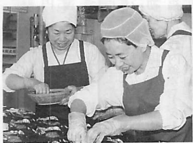
1日約40食分を手際よく盛り付け

●近所に一人暮らしのお年寄りがいますが、このごろ顔を見かけません。元気であるのか心配です。