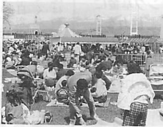
水族館でお昼を食べながら休日を満喫

9 母恋富士下桜まつりスタート 衣料品や家庭用品などを破格値で即売する自由市場が中央町アーケードで開催