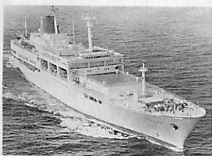
豪華客船寄港第1弾「新さくら丸」

豪華客船の室蘭寄港第1弾として、全長175・8mの「新さくら丸」が、約550人の乗客を乗せ、入港します。