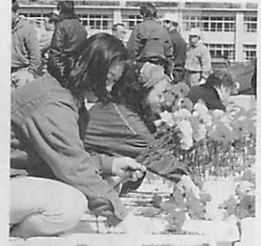
母恋のマチを彩った2万3千本のカーネーション

28 室蘭開発建設部は白鳥大橋ケーブル工事の足場(キャットウォーク)の架設を8月開始と発表 市が追直漁港地域整備構想を明らかにする 29 ポート教室開講。港で初こぎを楽しむ 市民健康マラソン開催。308人が健脚を競う 母の日にちなみカーネーションロードがスタート