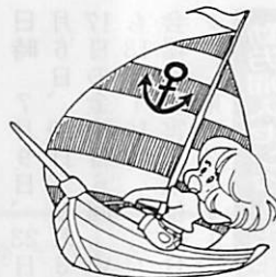
この夏、ヨットに挑戦してみよう!

市民ペタンク交流大会 だれでも簡単にできる軽スポーツの普及を目的に、ペタンクの講習会と交流大会を開きます。 日時 6月13日(日)9時30分(受付) 会場 中島小学校グラウンド