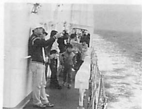
すばらしい自然に感動の数々

室蘭には、雄大な自然景観をはじめとして、ハヤブサに代表される野鳥や鯨、イルカなども見られるなど素晴らしい環境に恵まれています。こうしたことから、昨年4月に『ネーチャー・ウォッチング基金』を設け、自然観察を通して自然に対する認識を高めてもらおうと、様々な事業を行っています。