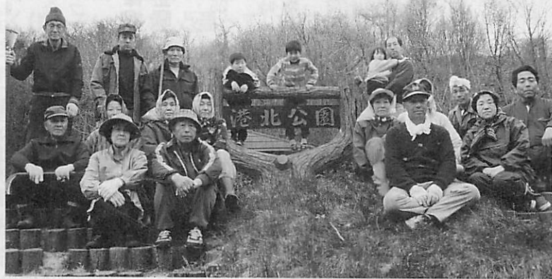
「公園を花と緑でいっぱいになりたい。——。皆さんの願いは一つ

市道柏木中央通線沿いの両側をエリアとする港北町二丁目町会。町会の顔である港北公園は、市内でも指折りの自然を生かした公園で、その環境美化に意欲を燃やしている。 「清掃活動に快く協力してくれる皆さんに支えられて、ここまでできました」と公園を見ながら、感慨深げに話す保坂町会長。