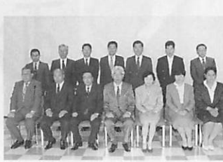
篤志善行表彰を受けた皆さん