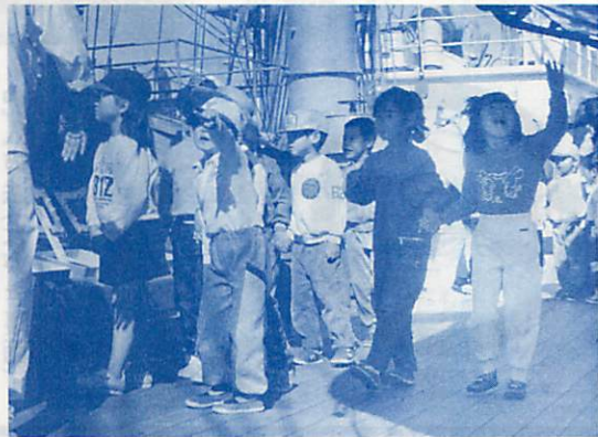
▶チビっ子たちも大喜び

国の進学ローン 高校・大学などの進学に 高校、大学などに進学するために必要な資金をお貸しします。 ▽融資額 進学者1人につき、50万円以内 ▽貸付利率 年6.4% ▽返済期間 進学先の修業年限以内 ▽申込期限 63年4月30日(土)まで 詳細 国民金融公庫室蘭支店 ☎44-1731