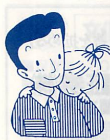
あなたのやさしさを...

恵まれない子に愛の手を あなたも里親になりませんか！ 子供の成長にとって、親の愛情や温かい家庭は、とても大切なものです。 しかし、不幸にも何らかの事情で親と一緒に生活できない子供が大勢います。この子供たちのために、里親になっていただきませんか。 ◇里親制度とは：◇ 児童福祉法で、親が引き取れるようになるまでの間、親代わりになって家庭で養育してもらう