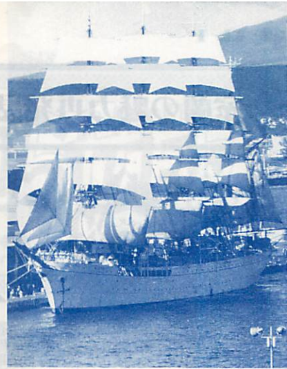
▲訪れた人たちに夢を与えたセイル・ドリル

昭和5年に建造され、2年後に引退が予定されている、海の貴婦人「海丸丸」が10月15日、室蘭港に入港し、多くの帆船ファンを魅了した。18日に行われたセイル・ドリル(帆を張る訓練)には、最後の雄姿を一目見ようと、市内外から1万5,000人ものが詰め掛け、(2日間で2万6,000人が見学)その華麗な姿に歓声を上げていた。