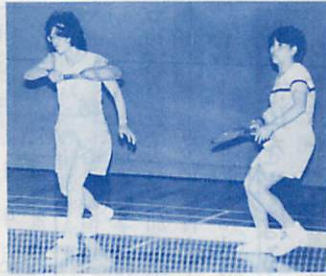
あなたも一振り さわやか気分