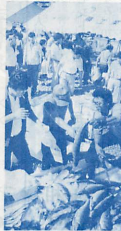
安くて生きがいいよ