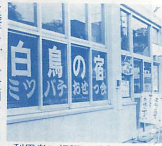
利用者に好評の「白鳥の宿」

ミツバチおせつ会 主に、オートバイ旅行のミツバチ族などに対し、蘭西の有志が集まり無料簡易宿泊所「白鳥の宿」(海岸町3-1-3)の管理、運営を2年前から行い、市内の観光案内、飲食店の紹介などを網羅した「室蘭通行手形」