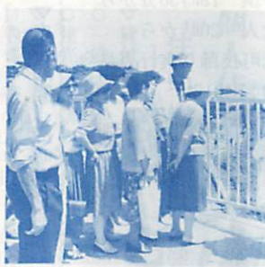
観光室蘭の推進役に

ボランティアガイド協議会 昨年行われた「観光ボランティアガイド養成講座」で認定された約100人が協議会を結成。地域を見直す学習会や美化活動、