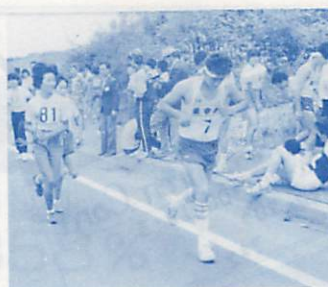
仲間同士で楽しく走ろう!