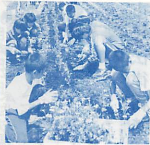
中学生も花壇づくりに一役

いるマチを緑いっぱいにする運動をより充実させようと、高校総体などの全国規模のサッカー大会を契機に文字どおりマチを花で飾る、市民総ぐるみのホスピタリティ運動を展開し、市民共同の花壇づくりなど、マチのイメージアップに役立っている。 ※そのほかにも個人や団体、町会などで多くの人たちが清掃奉仕や親切運動を行っています。ホスピタリティは、一人ひとりの心の運動といえます。