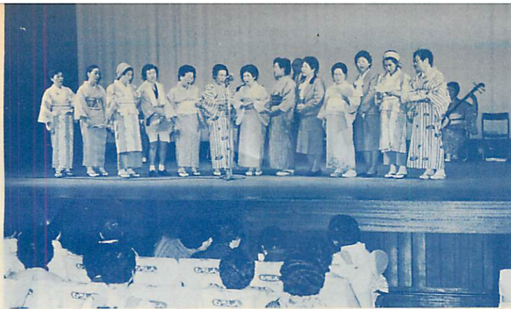
▲高齢者教室芸能発表会=11月1日=