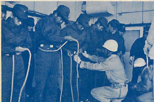
▲一日消防隊員を体験—日本ボーイスカウト胆振地区シニア隊の団員20人が10月19日、一日消防隊員を体験した。参加したメンバーは、早速レスキュー隊の制服に身を固め、高さ30メートルのはしご車に試乗。綱渡りにも挑戦するなど、消防隊員の日ごろの訓練を肌で感じていた。