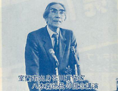
室蘭市出身芥川賞作家 八木義徳氏の記念講演

日ごろ学んだ成果を発表しようと、 11月3日の「文化の日」を中心に、 各種団体やサークルの催しものが盛 りだくさん開かれ、各会場では、な ごやかな交流が行われていました。