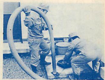
計画収集にご協力ください