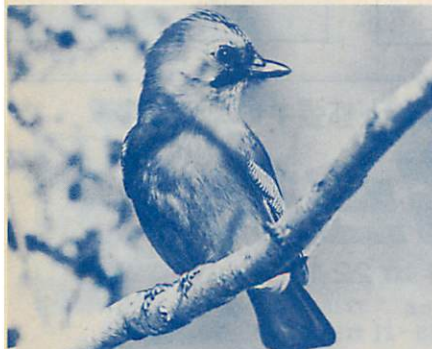
茶目っ気たっぷりにものまねもするカケス

冬鳥たちがやってくる季節になりました。春の天候不順がたり、野山の実りが悪いのでしようか？ 今年、いつもの年より早い鳥たちの訪れです。測量山も南へ渡る鳥たちで大にぎわいです。メジロやホオジロ、ツグミ、ヒヨドリに混じり、大型の鳥では、オオタカ、ノスリ、ミサゴ、ハチクマなどが見られます。また、山から里に降りてきた仲間には、ヒガラ、シジュウカラ、エナガ、ウソなどのほかに、カケス、ホシガラス、オオアカゲラ、そして天然記念物のクマゲラまでが、「キヨーン」とよく通る声を聞かせてくれます。