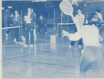
楽しい汗を流しませんか！