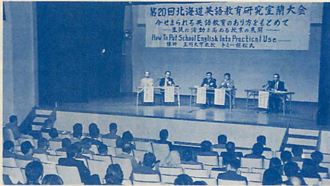
▼英語教育の振興を一「今せまられる英語教育のあり方をもとめて」をメインテーマに11月7日、8日の2日間、カトリック女子高校で北海道英語教育研究大会が開かれた。この大会には全道から約500人の関係者が出席。パネルディスカッションでは、玉川大学のトミー・植松教授も参加し、熱い意見交換が行われた。

一日消防隊員を体験—日本ボーイスカウト胆振地区シニア隊の団員20人が10月19日、一日消防隊員を体験した。参加したメンバーは、早速レスキュー隊の制服に身を固め、高さ30メートルのはしご車に試乗。綱渡りにも挑戦するなど、消防隊員の日ごろの訓練を肌で感じていた。