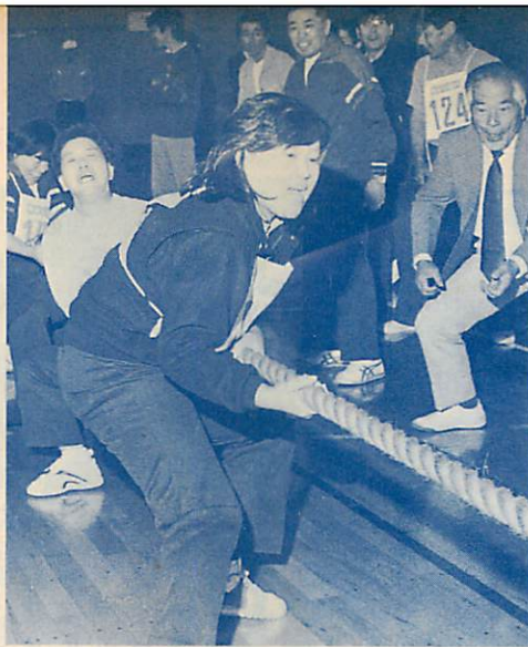
◀気分そう快、はじける汗—「体育の日」の10月10日、第5回市民体育祭が行われた。会場の市体育館には、親子連れも含め約600人が参加。一輪車乗りや綱引きなど、多様なゲームに歓声を上げていた。