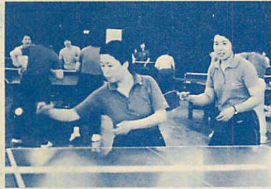
ストレス解消と楽しい仲間づくりも