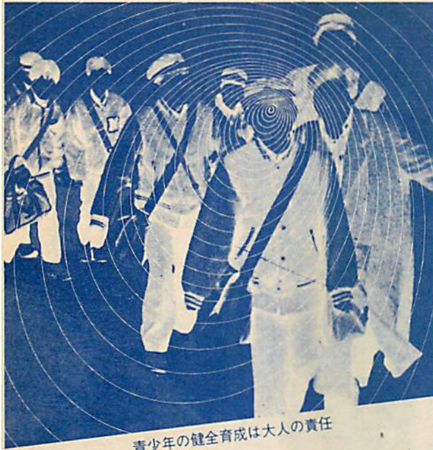
青少年の健全育成は大人の責任