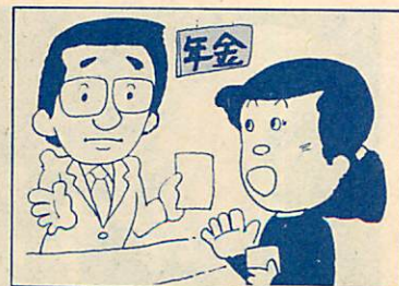
年金は一人ひとり条件が異なります。疑問に思ったら至急相談を

事例1 夫と死別した昭和2年生まれの妻で、現在、共済の遺族年金を受けながら会社に勤務し、厚生年金を掛けている。今後受ける年金はどうなるか? 事例2 昭和3年生まれの勤労婦人で、現在までに厚生年金の加入期間が20年あり、国民年金にも断続的ながら13年間加入していた。今後受ける年金はどうなるのか? ① 60歳になるまで、老齢厚生年金の受給資格が発生しないため、新年金法の適用となり、将来年金受給手続きをしても、(A)の②と同様にどちらか一方の年金しか受けられない。 ② 昭和3年生まれの勤労婦人で、現在までに厚生年金の加入期間が20年あり、国民年金にも断続的ながら13年間加入していた。今後受ける年金はどうなるのか? ① 退職しても厚生老齢年金を受けられるし、65歳からは老齢基礎年金(国民年金部分)も加算されて併給できる。 詳細 保険年金課国民年金係 ☎22111内線457