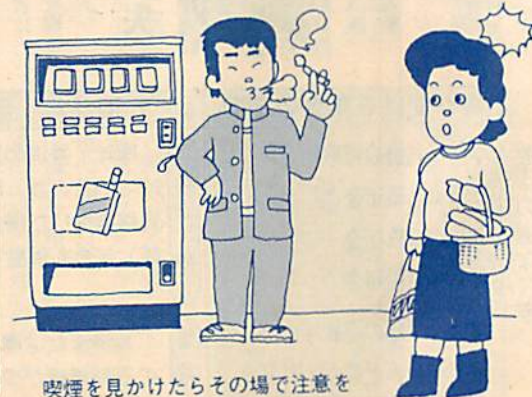
喫煙を見かけたらその場で注意を