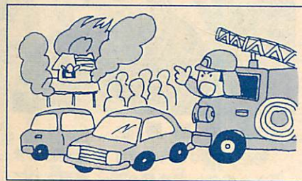
火災現場近くの駐停車は消火活動に支障をきたします。絶対にやめてください

対象となると思う人は 担当機関に確認を ただし、年齢、加入期間などで、異なってくる場合がありますので対象となると思われる人は、至急それぞれの年金担当機関に確認してください。 ◎ 厚生年金、船員保険：直接室蘭社会保険事務所窓口へ ◎ 共済年金：各共済事務局 では事例で説明しましょう