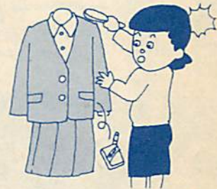
たばこを見つけたら要注意