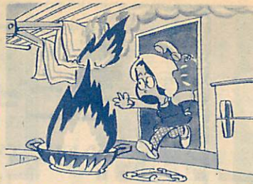
電話や来客応待の時は、ほんのちよつと思つても必ず火を消す

火災が多発 今年既に10件 ほんのちよつとの油断が... 市内では、今年に入って既に10件(2月24日現在)の火災が発生しています。 これらの火災は、天ぷら油、たばこなどいづれも、ちよつとした気の緩みが原因で大きな火災になっています。 ◇火災原因別にみると ◇たばこの不始末 3件