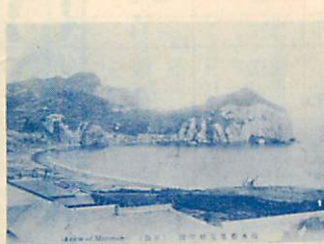
砲台があつて、ナマコ伝説を今に残す築港前の追直浜

追直浜には「ボロ(洞窟)」地名があり、「松前家二謁見ノ途中、此処ノ洞穴中ニ舟待セシトキ女夷トモ浄瑠璃ヲ歌ヒシ処(永田方正)や「そこに幣群立する所」(知里真志保)の解釈があつて、同地に交易や祭事の拠点となるアイヌコタンがあつたことがしのべれます。