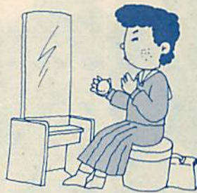
服装が派手になったら気を付ける