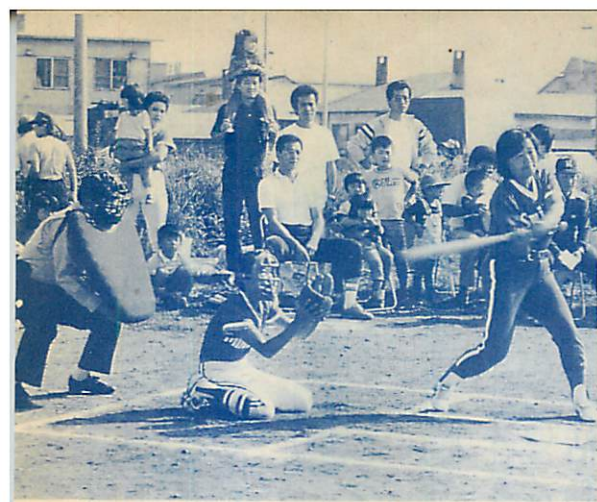
ママさんチームもハッスル—第4回市民ソフトボール大会が秋晴れの9月23日、栄高校グラウンドで行われ、参加した39チームは日ごろの練習成果を存分に発揮、終日熱戦が繰り広げられていました。