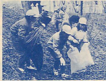
ゴミのない美しいマチめざして

「室蘭をきれいにする市民運動推進協議会」では、ゴミのないきれいな住みよいマチづくりを進めるため、市民一人ひとりに呼びかけるような標語を募集します。