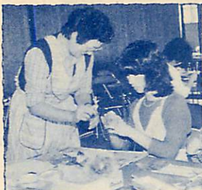
創作の楽しさを味わう