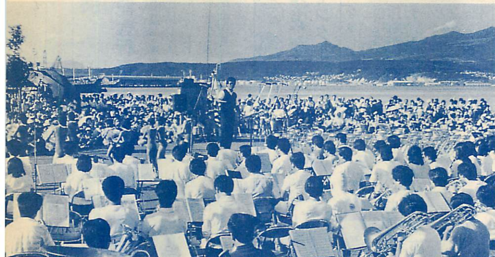
港に響くビッグなサウンド—さわやかに広がった秋空のもと、ダイナミックな音楽が港にこだまする—。 第3回吹奏楽野外演奏会「フラスインポート'84」が9月16日、入江臨海公園で開かれ、室蘭・登別市の16団体、580人が見事な演奏を披露、2千500人の市民も迫力あるサウンドの世界をたんのうしていました。

ベニシジミは、初夏6月の陽光を浴びて飛び出し出てくる小型のかわいらしいチョウです。今ごろの季節も、日中気温が高い日であれば、庭先のマリーゴールドやホウセンカなどの花を盛んに訪れます。 室蘭では、1年を通じ非常に長い期間見られる種類です。樹林地よりも、市街地の空き地や山間の道端のほうが多く見られるので、きつと覚えてくれる人も多いと思います。空き地や道端で多く見られるのは、このベニシジミの幼虫が、荒地地に好んで生えるギンギンやスイバの葉をエサにしているからで卵を産むには、これらの植物が生育している場所から離れられないのです。 日本の暖かい地方では、年3回成虫（チョウ）になりますが、室蘭では年に2回成虫になるようです。6