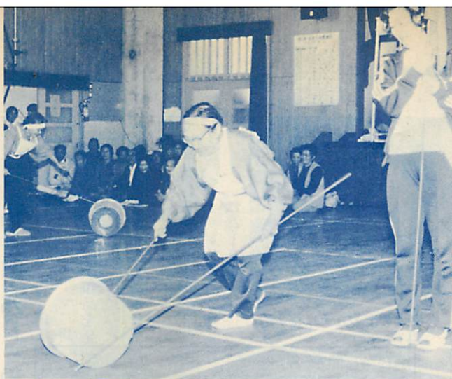
まだまだ元気一日ごろの運動不足と入所者の和を広げようと、10月4日「敬老荘」の第6回ほがら運動会が祝津分院体育館で行われ、「玉入れ」や「樽ころがし」などの種目に健康な汗を流しました。