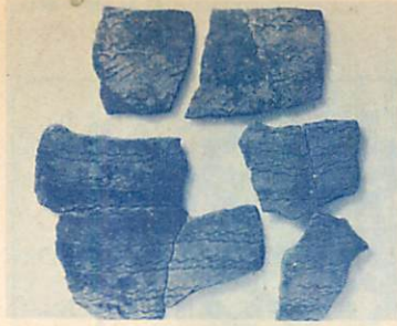
▲遺跡で見る室蘭最古（縄文時代早期）の生活用具。エンルム遺跡から出土した古別式土器片

室蘭には、埋蔵文化財包蔵地（遺跡や貝塚）が32カ所も存在していましたが、すでに宅地開発などで、その一部は姿を消しています。室蘭の代表的な遺跡としては、絵鞆半島の西端、標