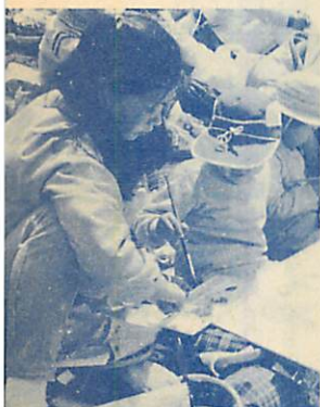
▲上手に書けたかな?—写生会