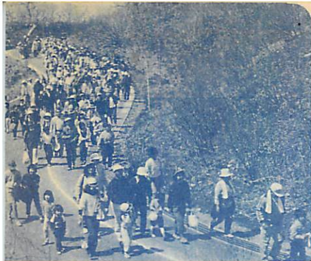
▲心地よい汗を流したムロランウォーク

五月晴れに恵まれた5月20日の日曜日。第34回測量山山開きが盛大に行われ、ポカポカ陽気に誘われて、約3万7千人の市民が参加。さわやかな春風に包まれ、楽しい1日を過ごしていました。