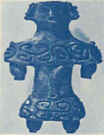
国立博物館で保存