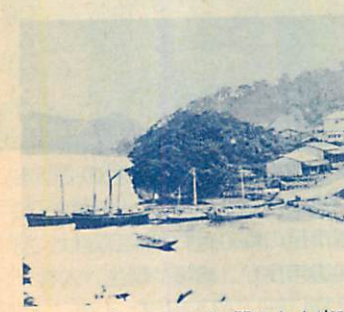
▲トキカラモイに開かれた当時の室蘭港