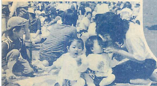
▲「おいしいね、このお弁当」