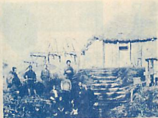
▲移住者とその家族たち

幕府は、外国船の侵略にそなえ、南部藩など東北各藩に、蝦夷地の警備を命じました。安政3年（一八五六）南部藩