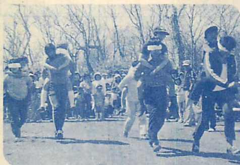
▲ハッスルプレーが続出—ファミリー広場—