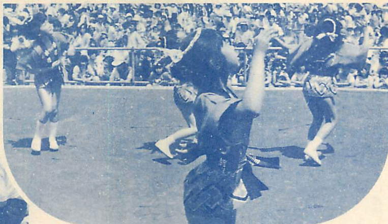
▲多彩な催しが行われた唐松平野外ステージ