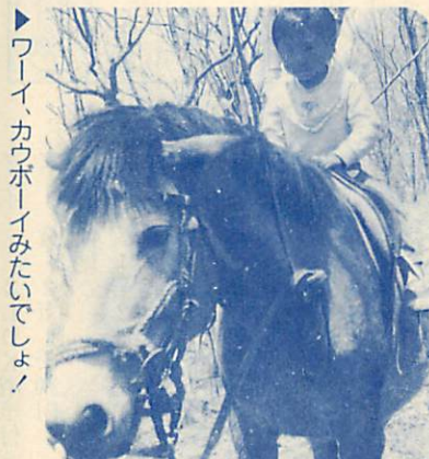
▶ワイワイ、カウボーイみたいでしょ!

6月は、生物の躍動の季節です。森では若葉が濃くなりはじめ、昆虫類も数多く姿を現します。この時期、森林の下部ではひとつの変化が起こっています。それは、林床を覆っていた「春の短命植物」といわれる、ニリソウ、エンレイソウ、フクジュソウ、カタクリなどの植物が開花結実し、枯れはじめることです。4月に雪が消えるや否や、すぐ芽を出し、樹林の木々が葉を広げないうちに、林床に届く、春の陽光を浴びて開花する植物群がこれなのです。この春の短命植物の消長に合わせて姿を見せる代表的な甲虫に「カタクリハムシ」がいます。甲虫のなかで、生きた宝石といわれる程、鮮やかな光沢を持つ種が多いハムシ科の仲間のうちで