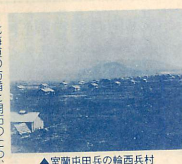
▲室蘭屯田兵の輪西兵村