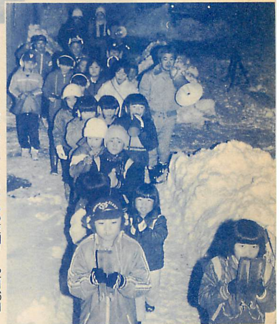
▷寒さについて栄町会チビッコたちの夜回り= 12月26日 =