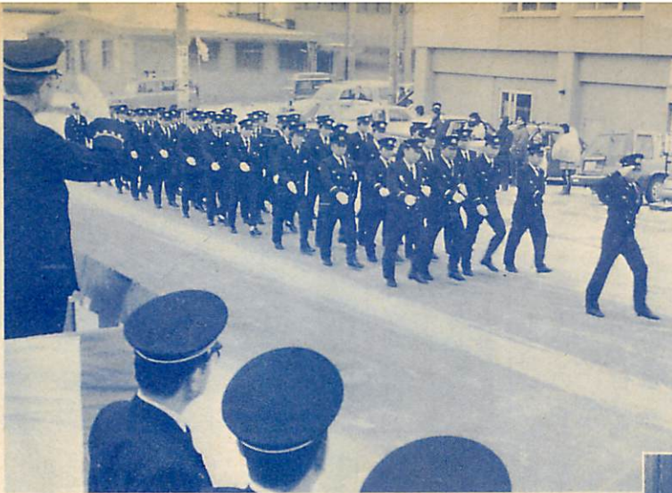
△火災絶滅を願って、消防出初め式= 1月6日=