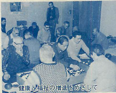
健康と福祉の増進をめざして

福祉の面では、障害者福祉都市の指定をめざすとともに、「サングライフ室蘭」を核として、中高年齢労働者の健康と福祉の増進を図ってまいります。