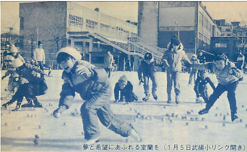
夢と希望にあふれる室蘭を（1月5日武揚小リンク開き）