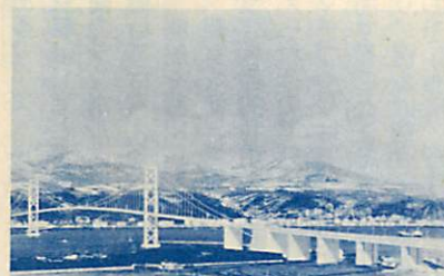
早期完成が待たれる白鳥大橋

道の早期工事着手と、北海道縦貫自動車道の白老インター〜室蘭東インター間の早期完成、更に昨年ルート決定し、路線測量に入った虻田までの区間の早期建設、国道36号NHK前から入江地区に至る局部改良事業の早期完成などについて、全力をあげて取り組んでまいります。