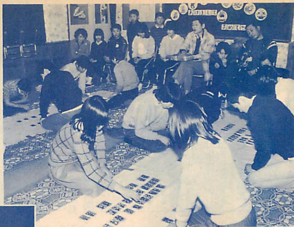
△子どもカルタ大会地区予選たけなわ—15回目を迎える同大会は、市内10地区から20チームが参加し、1月22日市体育館で行われます。日本古来のカルタの人気は、年々高まる一方で、今年は全市で約130チームが、地区代表の座を目指して予選を行っています。港南地区でも1月4日に児童センターで、熱戦が繰り広げられていました。