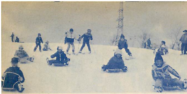
△お待ちかね、望洋台スキー場オープン—今年は1月15日から3月12日まで開設の予定で、期間中は簡易リフトが無料開放のほか、日曜・祝日には臨時バスも運行されます。