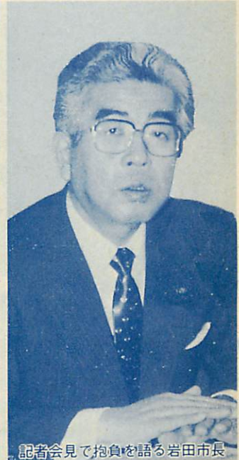
記者会見で抱負を語る岩田市長

1月4日に行われた、新春記者会見で、岩田市長は「室蘭には、まだまだ活用できる可能性や発展性の要件が残されている。私は今年を、全市民の行動する年」と位置づけし、市民の先頭に立って行動すると新しい年に向かっての抱負を述べました。