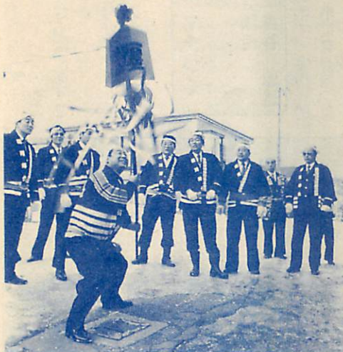
△防火の願いを纏(まとい)にかけ、マチを 練り歩く室蘭市消防団第3分団= 1月6日 =