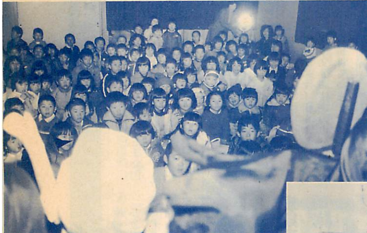
△立派になった子供たちの城—老朽化のため、全面改築中だった本輪西児童館が完成し、12月24日披露式が行われました。一回り広くなった児童館に約100人の子供たちが集まり、早速クリスマス会が行われ、歌や人形劇を楽しんでいました。