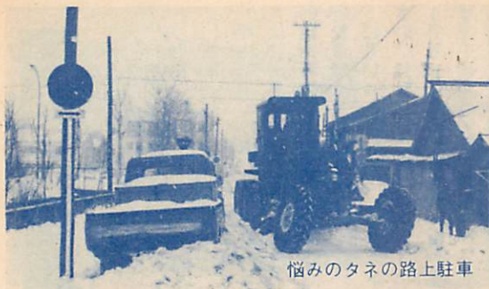
悩みのタネの路上駐車