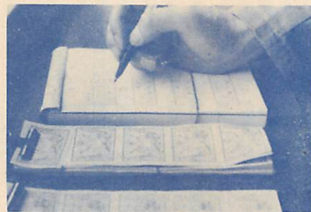
必ず、くみ取り券を購入して申込み下さい

年内に「くみ取り」を希望する人は、次のとおり申込み下さい。 ◎絵鞆町地域 12月20(日)まで ◎祝津町・大沢町地域 12月15(月)までに申込み下さい。12月16日以降の申込みは、1月6日以降のくみ取りとなります。 平常どおり、くみ取りを行います。集団くみ取り地域以外は、地域の締切日までに、必ず申込み下さい。 ＜申込み、申込方法＞ 地区サービスセンターかくみ取り券取扱所で、各家庭の便槽量に応じて、必ず「くみ取り券」を購入し、申込書に記入して下さい。