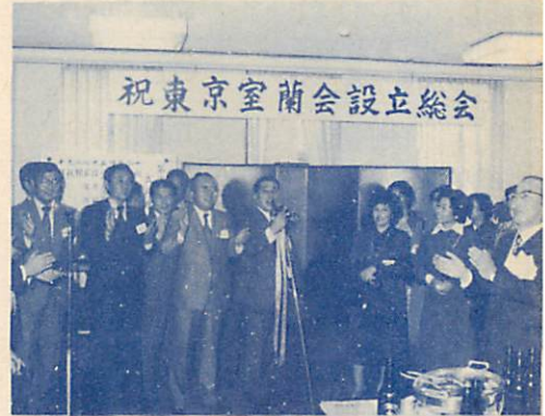
興高まって次々と母校の校歌の合唱も

東京近郷の室蘭市出身者によるふるさと会「東京室蘭会」が、11月15日東京旧丸ビルで、会員約300人が出席、盛大に発足されました。