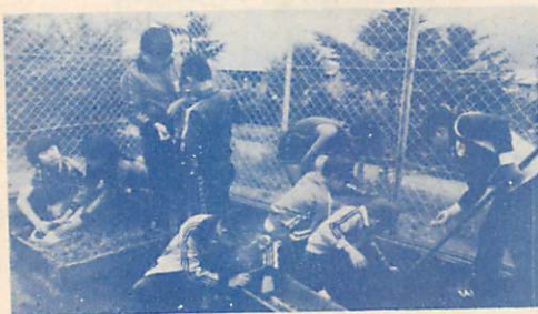
飼育小屋の手入れをする児童たち

私達の学校は、自然に囲まれた緑豊かな環境にあります。まず紹介したいのは飼育小屋です。そこで、うさぎ、にわ鳥、きじなどを飼っています。学校ではほとんどの人が動物好きなのでいじめたり、いたづらをしたりする人はいません。だから、動物達は人によく慣れていて、餌をもっていくと、チョコチョコと寄ってきて「早く餌を下さい」というように、手や、餌の入ったふくろをつきます。そんな様子がとても可愛いからか、学校では飼育委員になりたいという人が沢山います。それに大好きな動物達のためなので、仕事も一生懸命にしています。ところが、こんなに可愛がっている動物達が、一晩のうちに何者かに殺されてしまったのです。にわ鳥もうさぎもほとんど殺されてしまいました。その時は、飼育委員も先生も学校みんなもとてもやりがりました。先生達が調べたところ、犯人は多分近くの山から下りてきた、「きつね」らしいのです。この犯人を見つけたために、先生達は、わなをしかけたり金網の目を細かくしたり工夫をしたのですが、またまたきつねに入られて、今ではにわ鳥やきじは全滅、うさぎは四ひきしか残っていません。きつねにおそわれた時はどんなに恐かっただろうと思うと、みんな協力してこの小さな命をたすけたいと思います。又、飼育小屋ににぎやかな日があるようにと頑張りたいと思います。