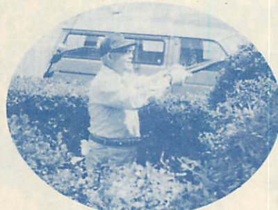
キメ細かなサービスが好評です