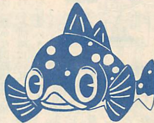
水族館のシンボルマーク アブラボウズ