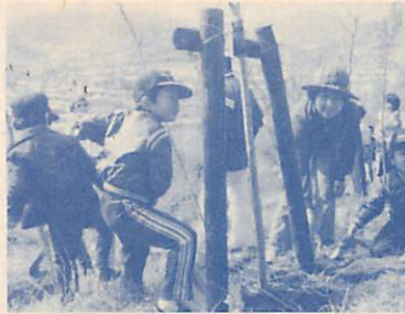
春の市民記念植樹から