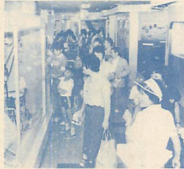
青少年科学館 1階展示室