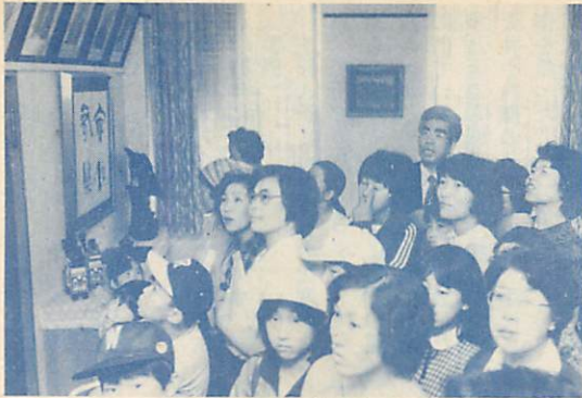
市長室で歴代市長らの紹介