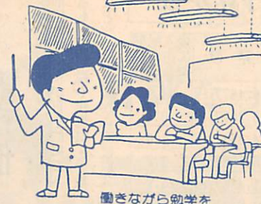
働きながら勉学を