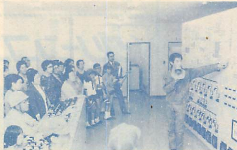
御崎清掃工場中央監視室

市政の現況を目と耳で確かめる「市民見学会」を、七月二十九日から十日間実施、延六〇〇人の市民が参加しました。 今年、青少年科学館、御崎清掃工場、中島公園、望洋台公園、民俗資料館の五施設を見学、活発