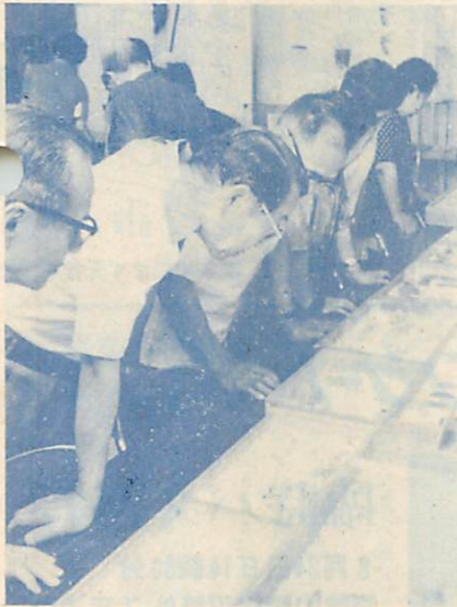
民俗資料館 「古代展一室蘭の考古遺物」