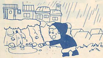
がけ地に住んでいる人は要注意!!