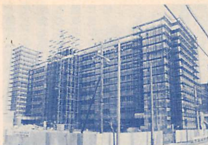
完成間近い改良住宅