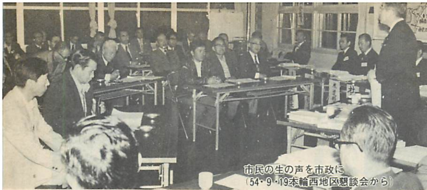
市民の生の声を市政に (54・9・19本輪西地区懇談会から)