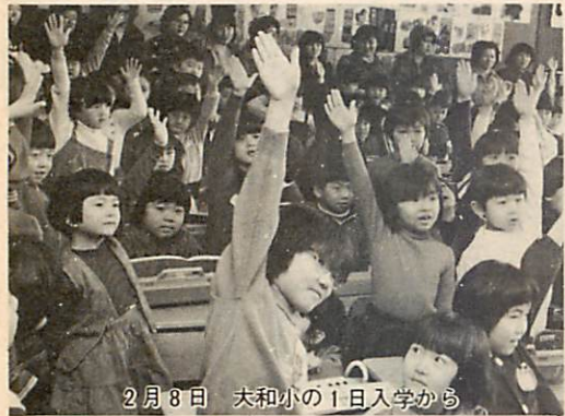
2月8日 大和小の1日入学から