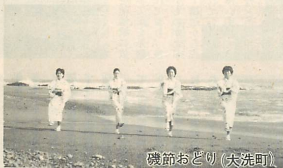
磯節おどり(大洗町)