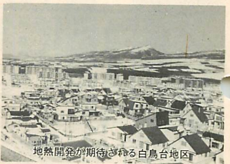
地熱開発が期待される白鳥台地区

産業の振興をめざして、三市合同による室蘭地域の企業立地説明会の札幌開催や本市出身者を中心とした、仮称「東京ふるさと会」の設立などを、立地基盤の拡充とともに推進いたす考えであります。また、観光開発につきましては、広域観光ルートを設定するなかで本市の特色を生かした観光地としての地位を高め、将来的には、都市型観光とレクリエーション型観光を備えた観光レクリエーション都市として整備に努めます。