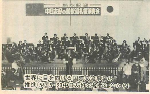
世界に目を向ける国際交流事業の推進(54・5・23中日友好の船載迎会から)

しかし、これら二十一世紀を展望した諸課題の実現にあたりましては、市民の熱意と時代の変化に即応したひたむきな努力が不可欠であると存じます。したがって、市民の皆様のお力添えをいただき、最善の努力をいたす所存でございますので、議会におかれましても、特段のご理解、ご協力をお願い申し上げます。