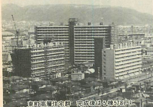
東町高層住宅群 完成後は5棟578戸に

財政再建の緒につくことを前提にいたしまして、経常経費の抑制、事業効果の精査、財源確保に最大の努力を払うなかで、市民の行政需要に対しては、重点的な考え方で編成した次第でございます。したがって、将来の財政負担や公債比率の過減に配慮する一方、特別、企業会計における不良債務についてはこれを凍結または削減することを前提に、一般会計からの繰出金を大幅に増額し、財政健全化に向けての一定のレールを引き、一方、内部経費について