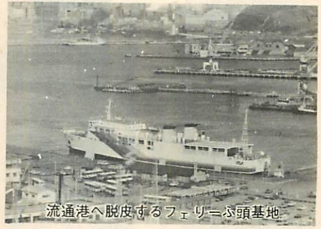
流通港へ脱皮するフェリーぶ頭基地

昨年、北海道知事の全面的支持をいただき、着々とその実現に向かって前進いたしておりますが、道内他港湾の誘致運動もあり、なお予断を許さないものがありますので、関係団体と連携を密に、より一層強力な運動を進めて参ります。さらに、企業の新規立地と既存