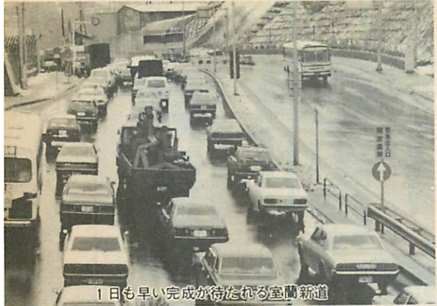
1日も早い完成が待たれる室蘭新道

室蘭港を囲み、半環状の本市の地形に対し白鳥大橋を軸とした交通体系の環状化は、焦点の課題であり、この