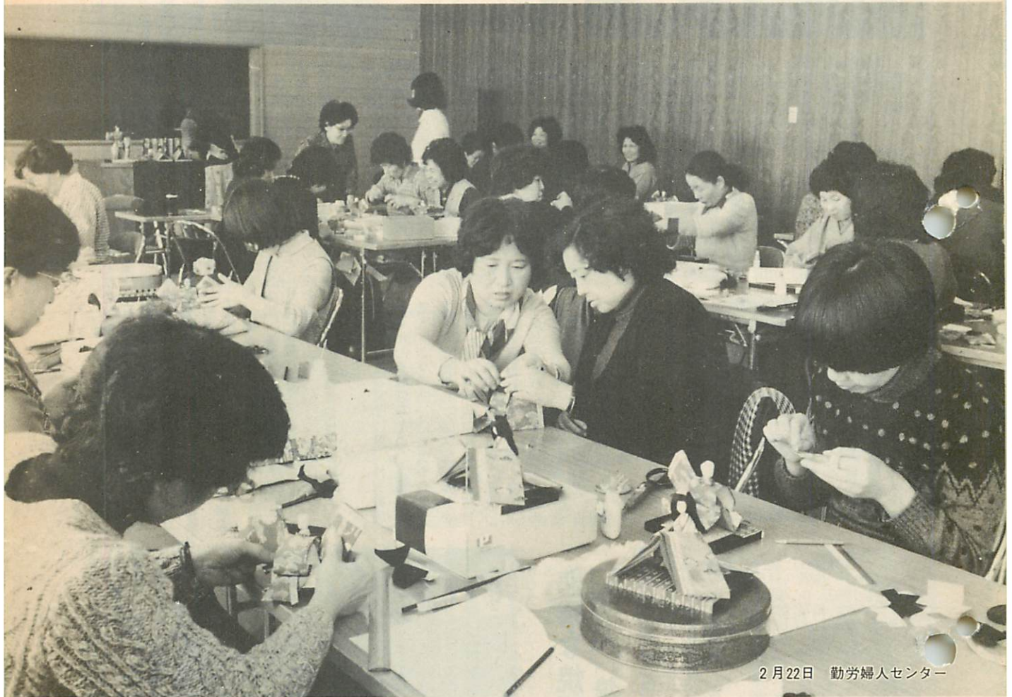
2月22日 勤労婦人センター