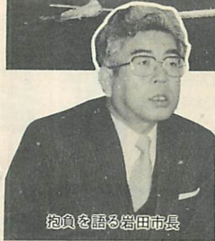
抱負を語る岩田市長