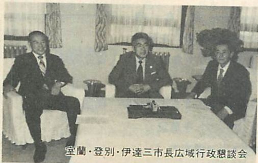
室蘭・登別・伊達三市長広域行政懇談会

室蘭は「国際都市」であるという印象、感覚を市民がもつためにも、外国との姉妹都市提携はぜひ必要と考えますので、十分な検討をして参ります。