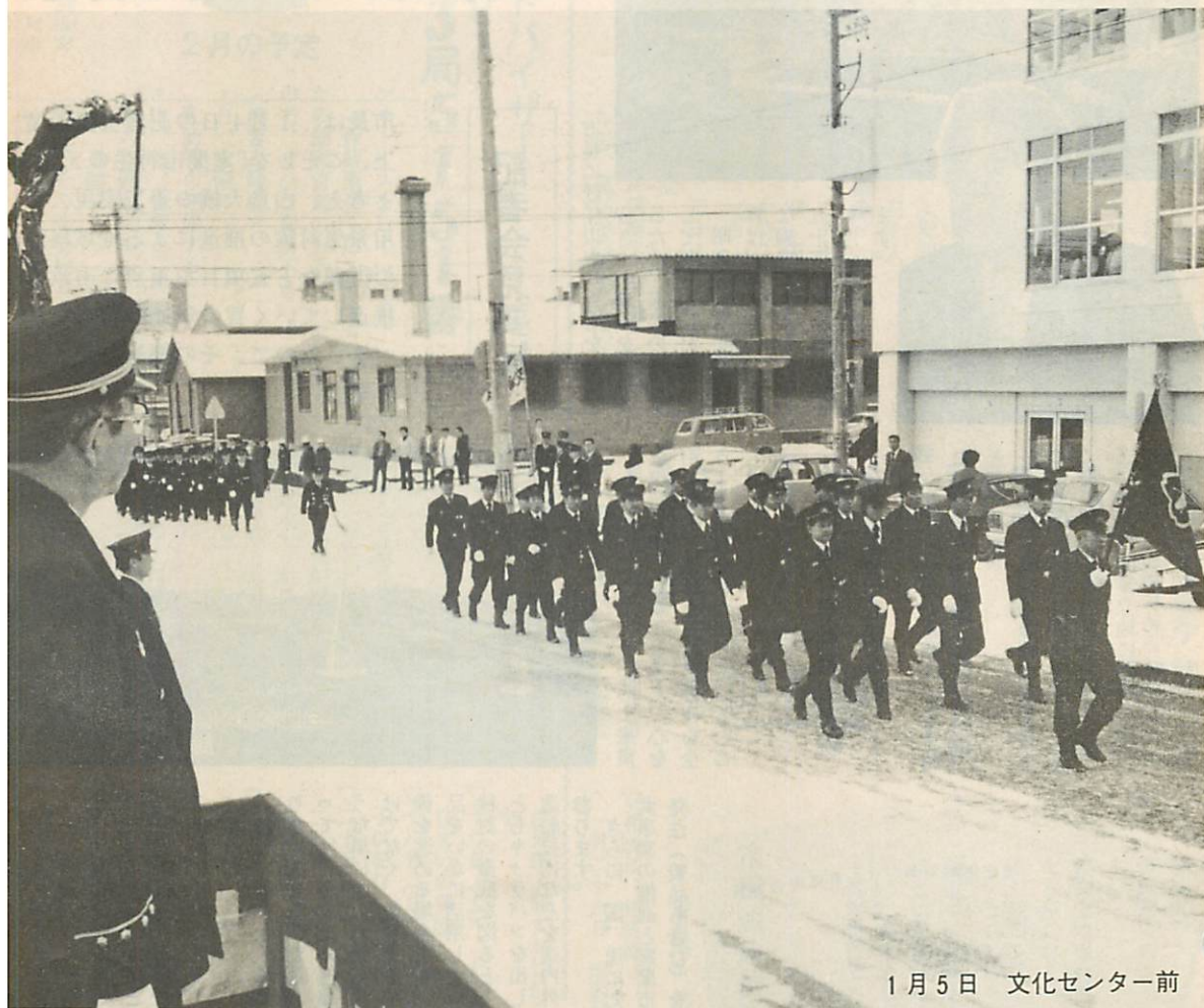
1月5日 文化センター前