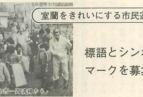
昨年5月 全市一斉清掃から

室蘭をきれいにする市民運動推進協議会では、ゴミのないきれいな住みよい街づくりを進めるため市民一人ひとりに呼びかけるような標語と親しみのあるシンボルマークを募集しています。 ▽募集部門 ・標語 ・シンボルマーク ▽賞 ・優秀二編 佳作二編 ・シンボルマーク ・優秀一点 佳作一点 ※作品の著作権は、主催者に属し応募作品は返却しません。 ▽発表 優秀作品、佳作作品は市政だより、新聞などで発表します。 問合せは、同協議会事務局（☎☎一一一内線三九二、三九三）まで。