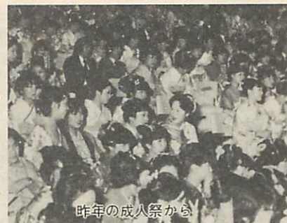
今年の成人祭から