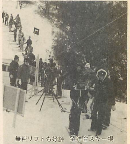
無料リフトも好評 望洋台スキー場