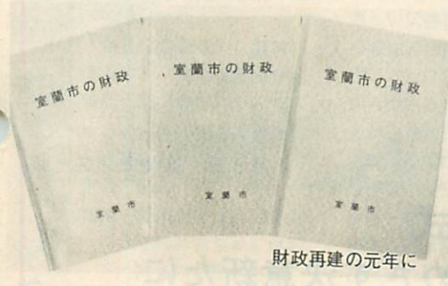
財政再建の元年に

さらに、国、道に対しては、公共事業の推進と室蘭市内企業への発注(製品も含む)を要請するな