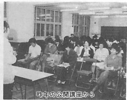
昨年の公開講座から

本年度から、市民を対象に、生徒とともに学ぶ「開放授業」と「公開講座」を道内で初めて実施するなど地域に密着した学校運営に努めています。