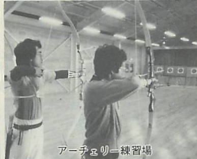
アーチェリー練習場