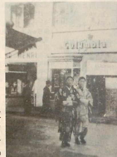
写真は、浜フラ(銀フラ)と同意語を楽しむ若い娘さんたち

明治・大正・昭和初期にかけての、こうした民俗的資料、習慣を知るため、古い写真や、絵ハガキなどを探しております。