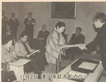
11月2日 優良家庭表彰式から

ことなく、また督促を受けずに保険料を完納した皆さんを健康優良家庭として表彰状と記念品を贈り表彰しました。