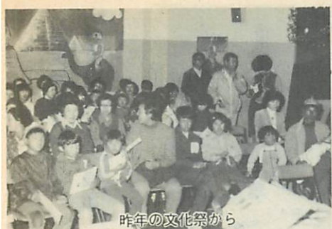
昨年の文化祭から

崎町の徴収義務者を対象に。 問合せは、市民税課市民税係(三三二) 一〇一内線(三七)まで。