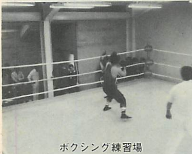
ボクシング練習場