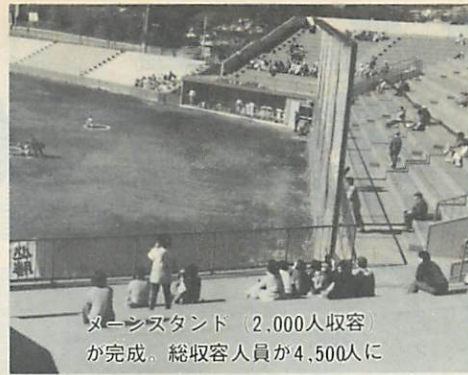
メインスタンド 2,000人収容が完成。総収容人員が4,500人に