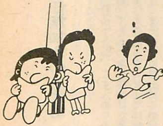
シンナー遊びをやめさせよう

シンナー遊びは、シンナーや接着剤の有機溶剤を吸入することによってめいてい状態になる遊びですが、これら有機溶剤中の主成分であるトルエン、酢酸エチルなどが、神経細胞の機能をまひさせ、特に大脳の働きを抑制し、理性や判断力をまひさせ、大胆、粗暴となり、ひいては犯罪を起こすなどいろいろな非行の原因にもなり、また多くの死亡者も出ております シンナー遊びを防止するため へ家庭では シンナーや接着剤の正しい取扱