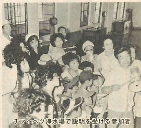
チマイベツ浄水場で説明を受ける参加者

市の施設などをバスで案内して市政の現況とこれからの計画を目と耳で確かめてもらい、市の仕事について一層の理解と協力をいただく、今年の動く市政教室は、八月一日から十日間開かれ、主婦、お年寄り、児童など四百六十人が参加しました。