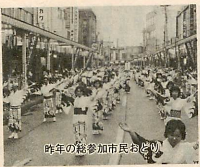
昨年の総参加市民おどり