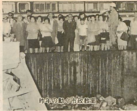
昨年の動く市政教室