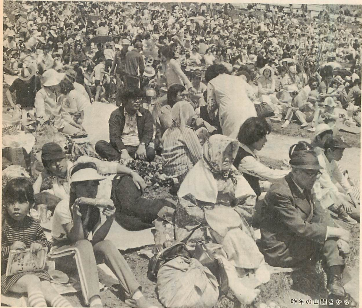
昨年 （昭和52年） の山開きから