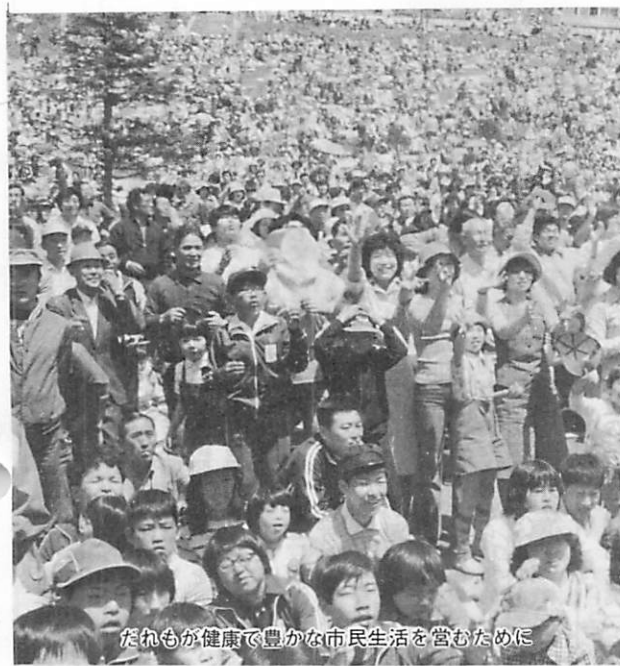
だれもが健康で豊かな市民生活を営むために

はじめに申し上げますとおり昭和五十三年度は、十年後を目標といたしました室蘭市総合基本計画の初年度でございます。市民の英知と創意を結集し、市民参加のもとに策定されましたこの新しいまちづくり計画は、きたるべき二十一世紀への橋わたしの役割を果し、ふるさと室蘭の輝やかしい未来を開く一里塚となるものと信じ