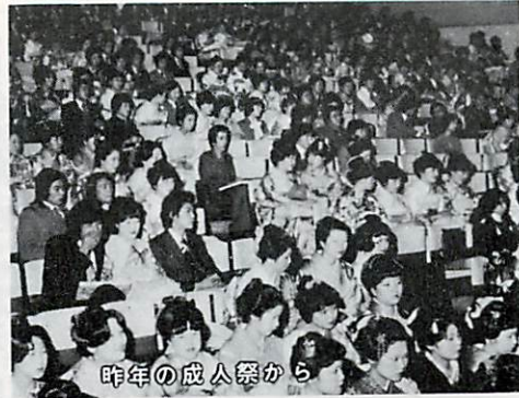
昨年の成人祭から

記念写真コーナー、サークル紹介コーナー、献血コーナーその他。 ▽会場 文化センター ▽該当事 昭和三十三年四月二日から昭和三十三年四月一日までに生れた方。