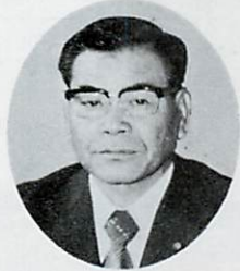
室蘭市議会議長 渡辺 定六