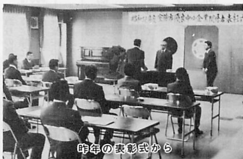
昨年の表彰式から