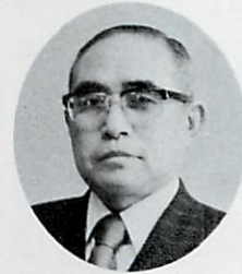
室蘭市長 長谷川正治