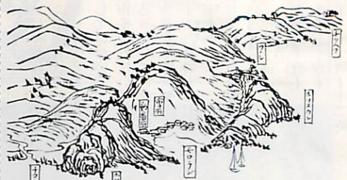
〈松浦武四郎・東蝦夷日誌〉

室蘭岳にまつわる伝説と市内の旧地名について二、三お正月らしく祭事についての話題を松