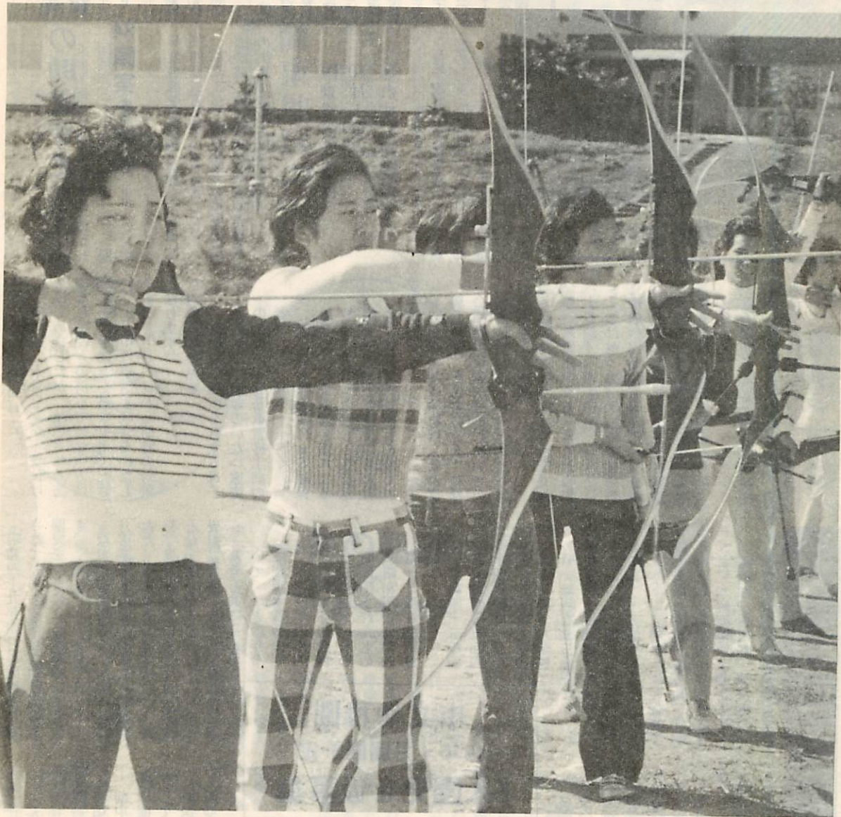
スポーツで心身ともに健康な体づくりを