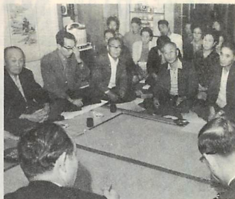
神代町での青空対話

市民本位の市政を進めるためには、市政に対する苦情や要望を的確には握し、それを市政に反映することが要請されます。市では、広く市民の声をきくため広聴活動を行ない、よせられた市民の声を市民本位の市政として実現していくよう努力すると共に、その声をまちづくりの一役として大切に取扱っております。