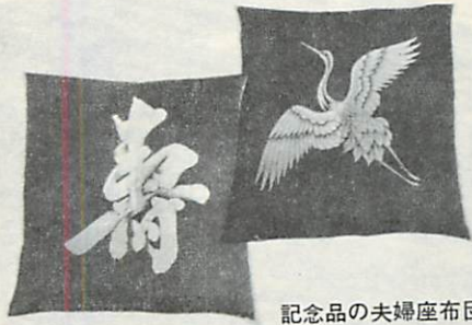
記念品の夫婦座布団