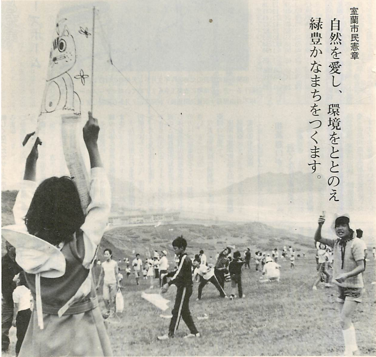
— 大海原を見渡すイタンキ浜にて —