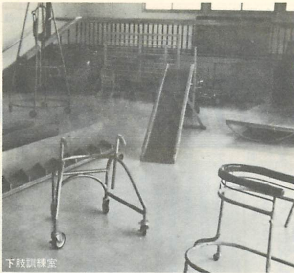
室蘭新道の建設のため、昨年9月から天神町の旧敬老荘に一時移転する一方、祝津町に改築工事をすすめていたマザーズホーム（肢体不自由児母子訓練通園施設）が完成、7月から開所しました