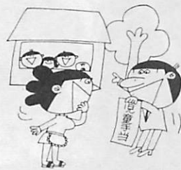
手続きは早めにしてください

この受給者証がなければ、病院や診療所などで診療を受けるとき無料で診療を受けることができ