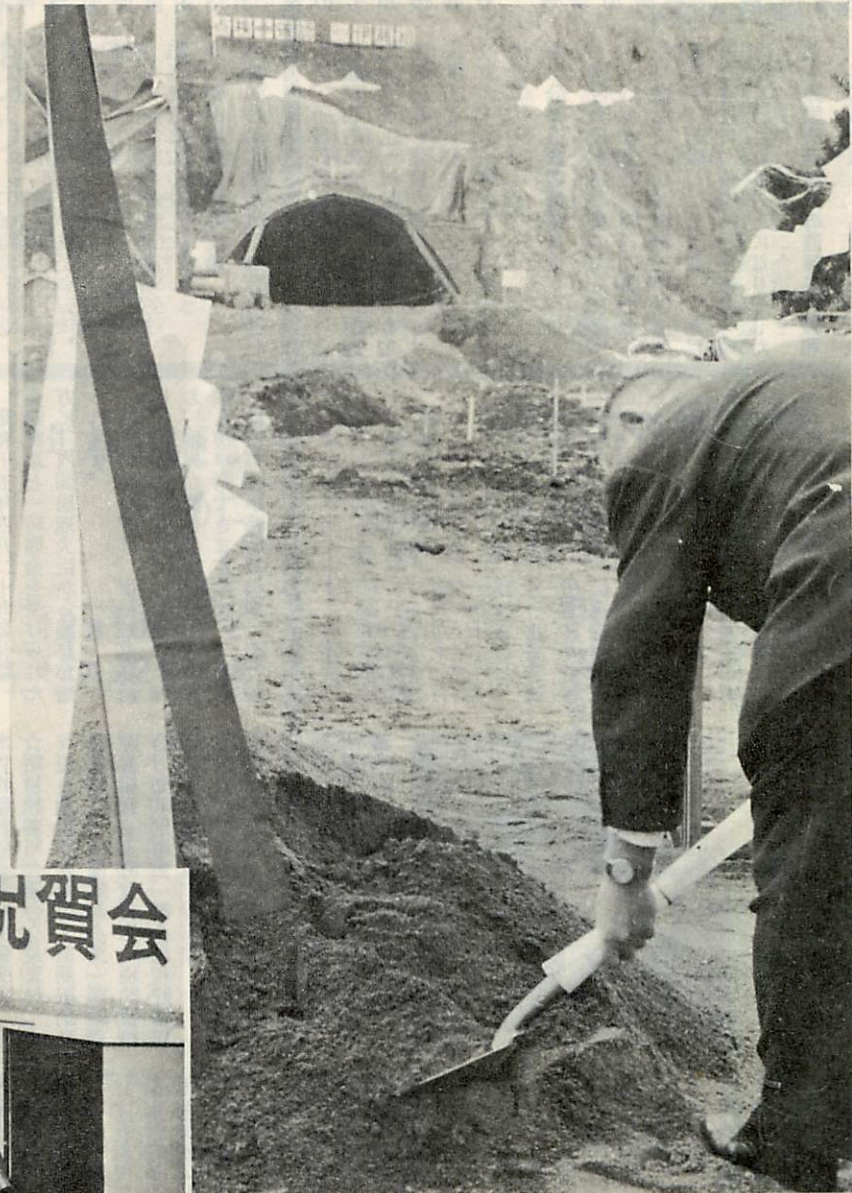
▲ 工事の安全を願ってクワ入れ……

永年の念願であった「室蘭新道」の起工式が、さる十一月十六日、栄高校裏の工事現場前で晴れやかに行なわれました。総工費九十六億円で昭和五十二年に完成される八・二キロメートルの新道も、これで、いよいよ本格的に工事が進められることになりました。