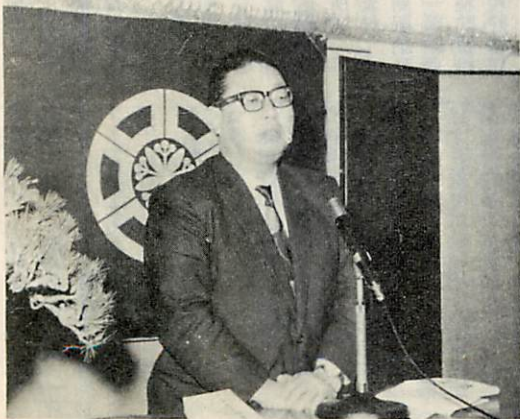
◀ 祝賀会で着工のよろこびを語る道副知事