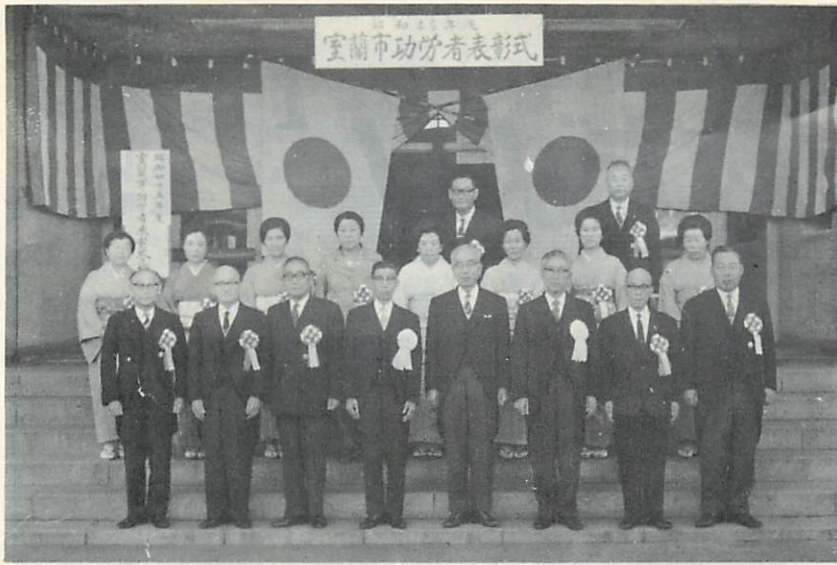
記念写真をとる受賞者