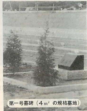
第一号墓碑 (4m 2 の規格墓地)

は、今後年次計画で全部望洋台霊園に移転しますが、移転費用は全額市が負担して行ないます。