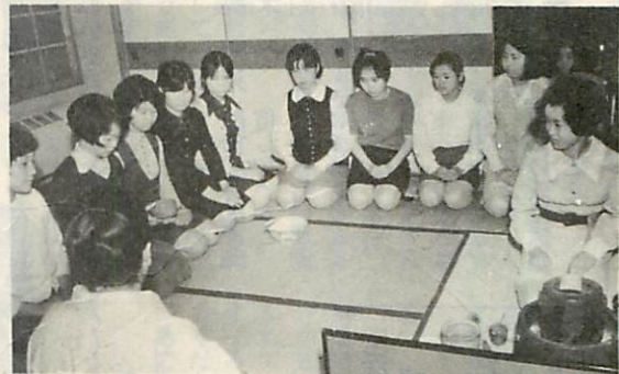
写真上…料理づくりにはげむ娘さん 下…みんなしんけんにお茶のけいこ

この勤労青少年ホームは、15～24才の働く青少年が、仕事の余暇を有意義にすごし、楽しいグループ活動の中で教養を深めるため、また、社会性を身につけるとともに、軽いスポーツで運動不足をおぎない、あすの仕事への意欲を高めても