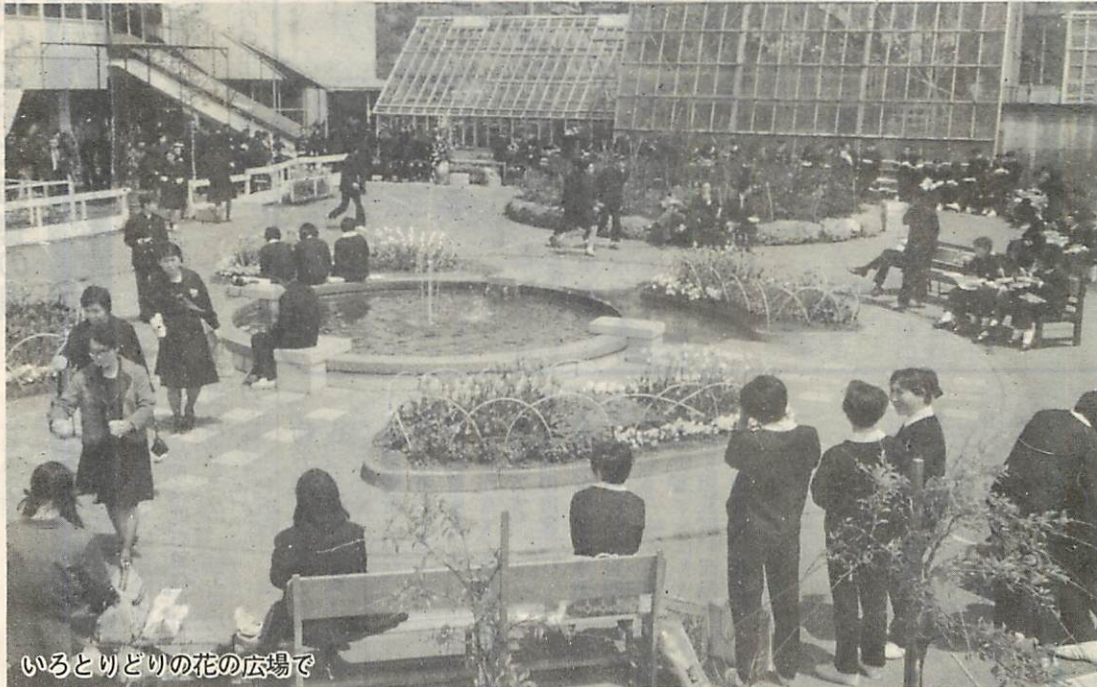
いろいろとどりの花の広場で