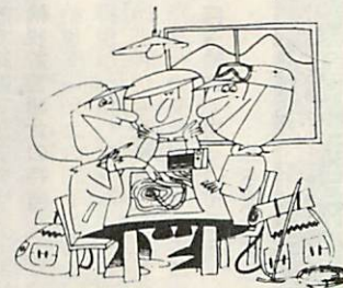
気象情報を確認、自分の体力技術、経験にあった山を選ぼう