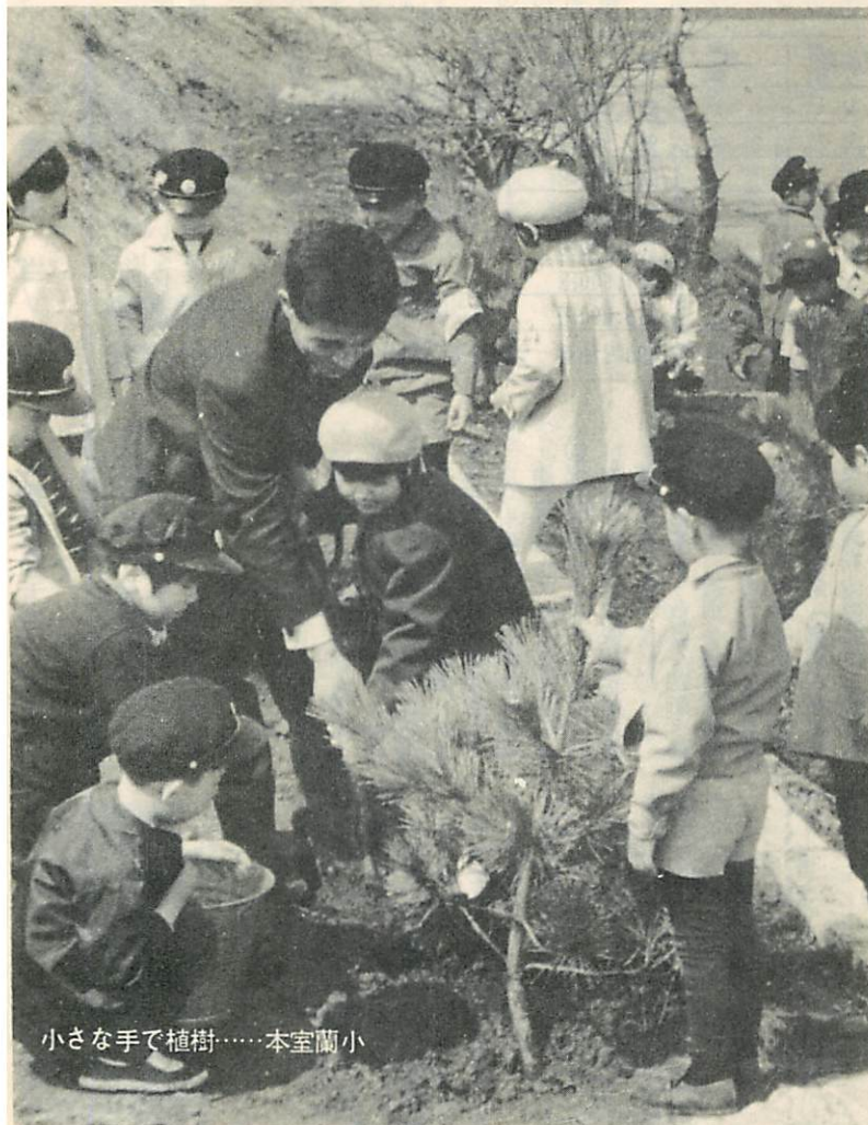
小さな手で植樹……本室蘭小