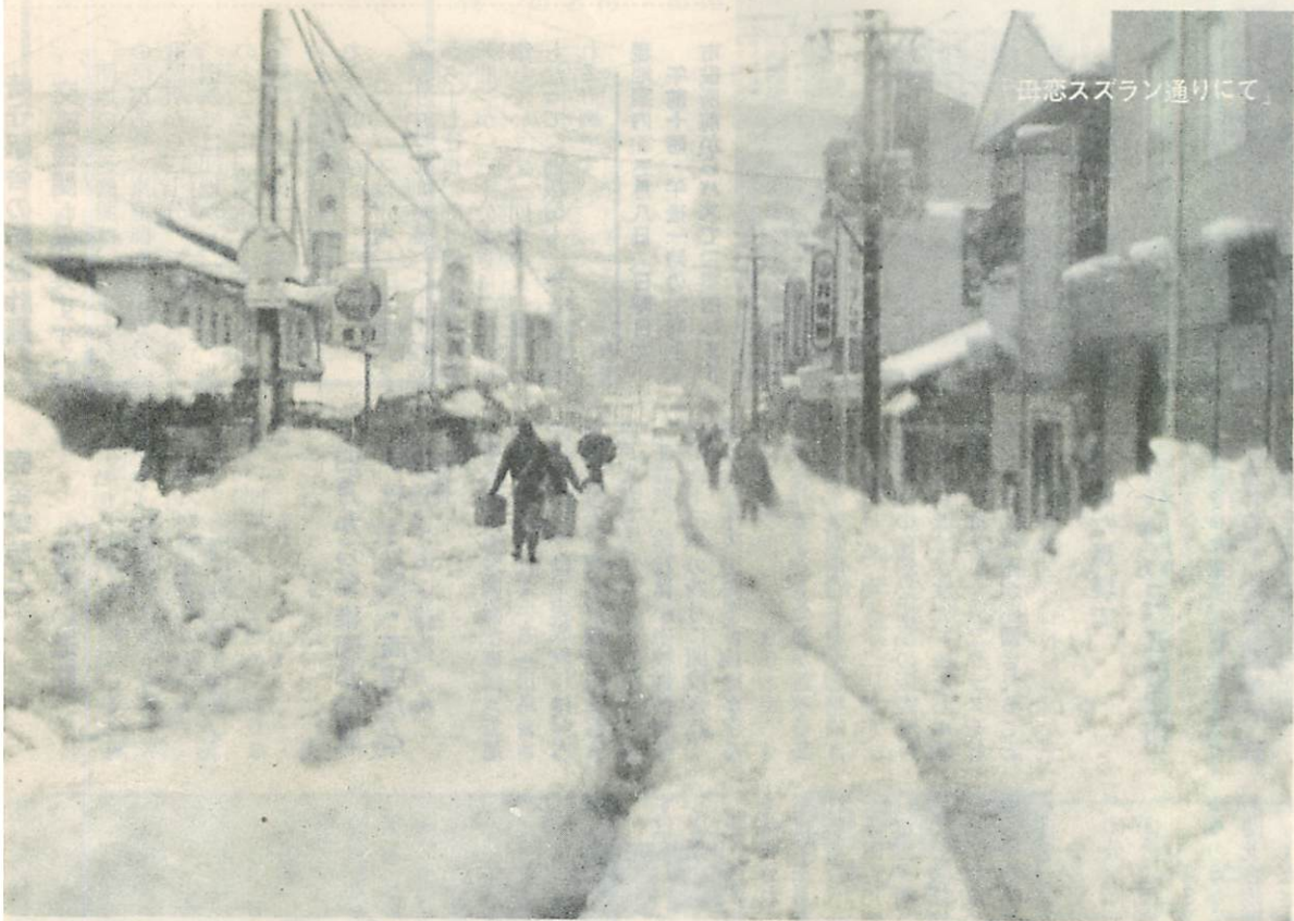
田恋スズラン通りにて