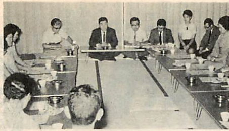
沢町会婦人部を対象としての説明会

市では、奥さん方に国民年金をよく理解していただくために、各町会の婦人部を対象とした説明会を各町内会ごとに開いています。どうぞ、多数参加ください。※詳しいことは、市役所保険課国民年金係（②一階）へ