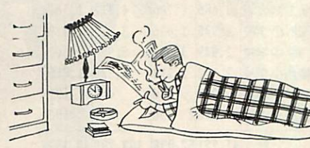
寝タバコはやめましょう

これから冬にかけて、火気の使用が多くなり、強い季節風とともに空気が乾燥し、大火になる危険性も多くなります。このような危険な時期を迎え、全市民がこぞって火災を出さないようにするため、秋の火災予防運動を十五日から三十一日まで行ないます。今年、一月から八月まで市内で三十一回の火災がありました。これを原因別にみると、(ア)七回 (イ)石油ストーブ 四回 (ウ)漏電 三回 (エ)飛火(煙突) 二回 (オ)子供の火遊び 二回 (カ)その他となっております。特に石油ストーブの安全な使い方などについては、次のことに注意しましょう。