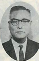
片岡 賢幸氏(市教育長)