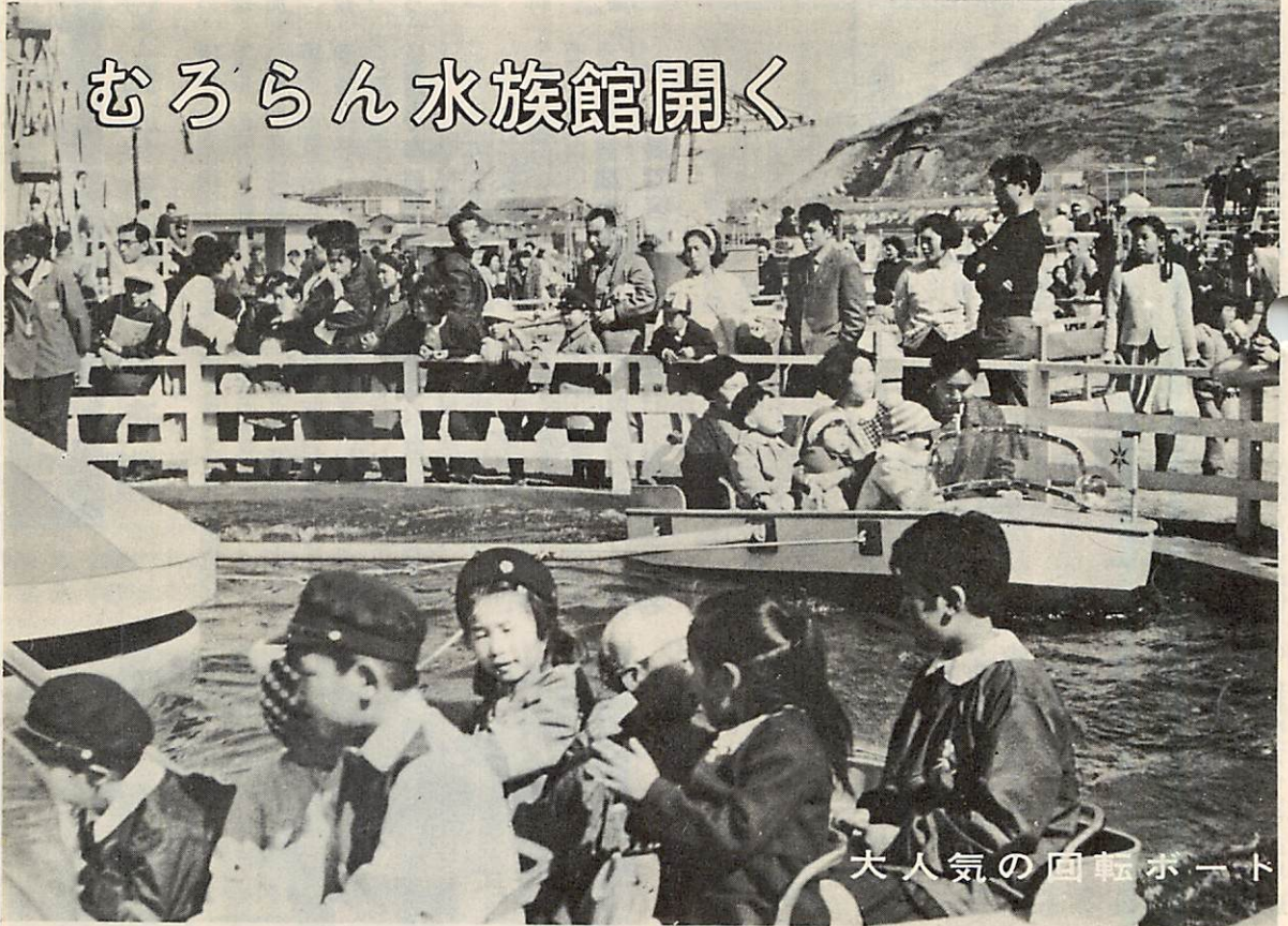
大人気の回転ボート