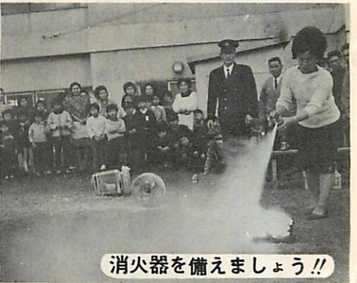
消火器を備えましょう!!

寒さのため、火の使用がはけしくなりました。そのうえ、年末の防火も忘れがちとなります。ことしは、火災で焼死する人が多く、十一月未現在、金道で百二十八人、室蘭市内では、四人が火災で死んでいます。