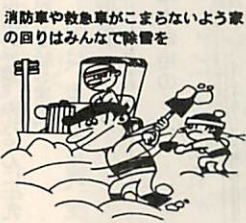
消防車や救急車がこもらないよう車の回りはみんなて除雪を

家庭用消火器の備え ○石油ストーブを使う所には、必ず家庭用の消火器を備え、みんなが使い方を知っておくこと ○老人や子ども、からだの不自由な人は、一階の安全な場所に寝かせること ○ロープやはしごを用意し、非常口はいつも使えるようにすること(屋内の階段は、火災のとき運で使えないことが多い)