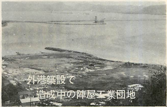
外港築設で 造成中の陣屋工業団地

◎総事業費、三十五億八千五百万円 ▽上屋三棟 ▽ふ頭用地造成(崎守ふ頭三十八万四千平方メートル) ▽シーゼル機関車一輛 ▽工業用地造成一五十二万九千