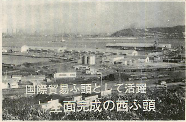
国際貿易ふ頭として活躍 全面完成の西ふ頭

東北・北海道唯一の特定重要港湾として、発展めざましい室蘭港は、工業港としての性格はもとより商港的性格も強く打ち出され国際貿易港とますます重要度を加えております。 さて、室蘭港の整備は、現在外港の築設をはじめ、西ふ頭の全面完成など着々と進められておりますが、さらに一段と整備推進するための、室蘭港整備新五ヶ年計画案ができました。その概要をお知らせしましょう。