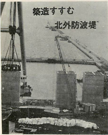
築造すすむ 北外防波堤

東北・北海道唯一の特定重要港湾として、発展めざましい室蘭港は、工業港としての性格はもとより商港的性格も強く打ち出され国際貿易港とますます重要度を加えております。 さて、室蘭港の整備は、現在外港の築設をはじめ、西ふ頭の全面完成など着々と進められておりますが、さらに一段と整備推進するための、室蘭港整備新五ヶ年計画案ができました。その概要をお知らせしましょう。