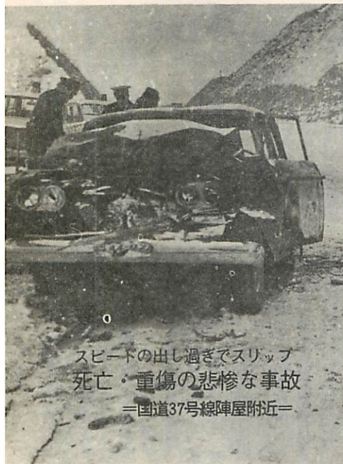
スピードの出し過ぎでスリップ 死亡・重傷の悲惨な事故 =国道37号線陣屋附近=