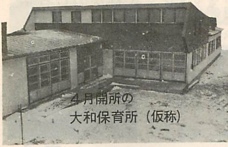
4月開所の 大和保育所 (仮称)

市内で八番目の市立大和保育所(仮称)が、東町西公園隣りに建設されています。工事は、昨年の十月にはじめられ順調に進んでほとんど完成現在、内部工事が急ピッチで行なわれています。木造モルタル塗り、平家建て延面積約三百四十四平方メートルで、工費は五百九十五万円です。収容児童数は、三才児未満の児童十二人を含め、六十人で、開所はことしの四月一日からの予定となっております。