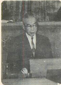
市政方針を説明する高薄市長