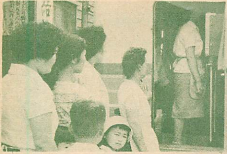
写真は今年の結核検診から

見かけだけの健康だけではあてになりません。ご家庭の幸福のため、この機会に一人ももれなく検診を受け健康で明るい生活を送りましょう。