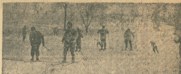
二月十一日市内測 量山で行われ、一 市民皆スキーデー は十四年振りの 降雪とて市内では 珍らしい四十余名 の参加があり、ス キー聯盟会員の指 導の下にオリンジ ック選手さながら の妙技を展開、 午後にはカン拍い 競技、回転、滑降 と童心にかえつて 一日の英気を養い 盛会裡に散会した (写真は市民皆ス キー風景)