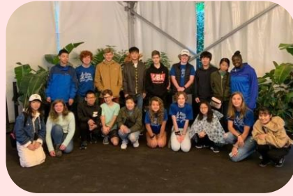
姉妹都市アメリカ・ノックスビル市との中学生海外交流事業