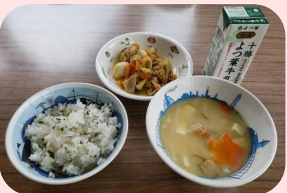
学校給食費の負担軽減