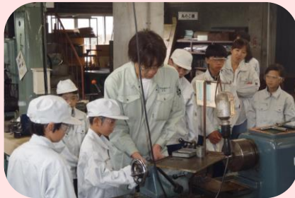
てついくプロジェクト