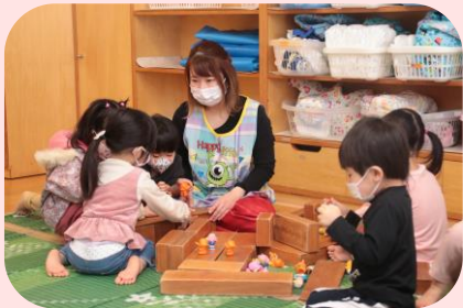
保育料などの負担軽減