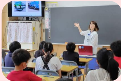
小学校出前授業によるキャリア教育