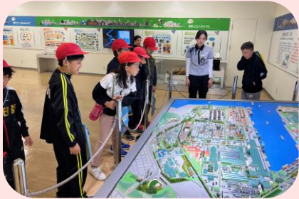
小学生の市内企業見学